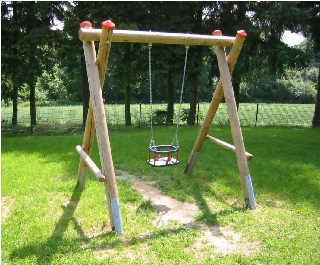
Abbildung: Schaukel aufgeständert auf feuerverzinkte Pfostenschuhe mit Kleinkindersitz, gegen Aufpreis.

Rundholz Ø 14 cm, kesseldruckimprägniert, Gummisicherheitssitz mit Stahleinlage, Schaukelketten verzinkt, Einzelaufhängungen aus V2A mit Drehwirbeln