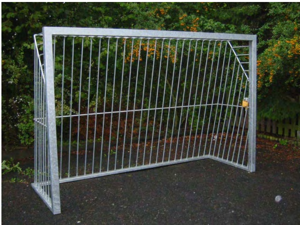
Abbildung: Fußballtor in Rundrohr Ausführung