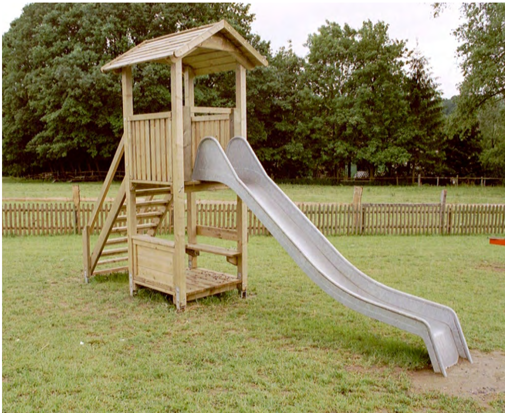
Abbildung: Anlage aufgeständert auf feuerverzinkte Pfostenschuhe, gegen Aufpreis