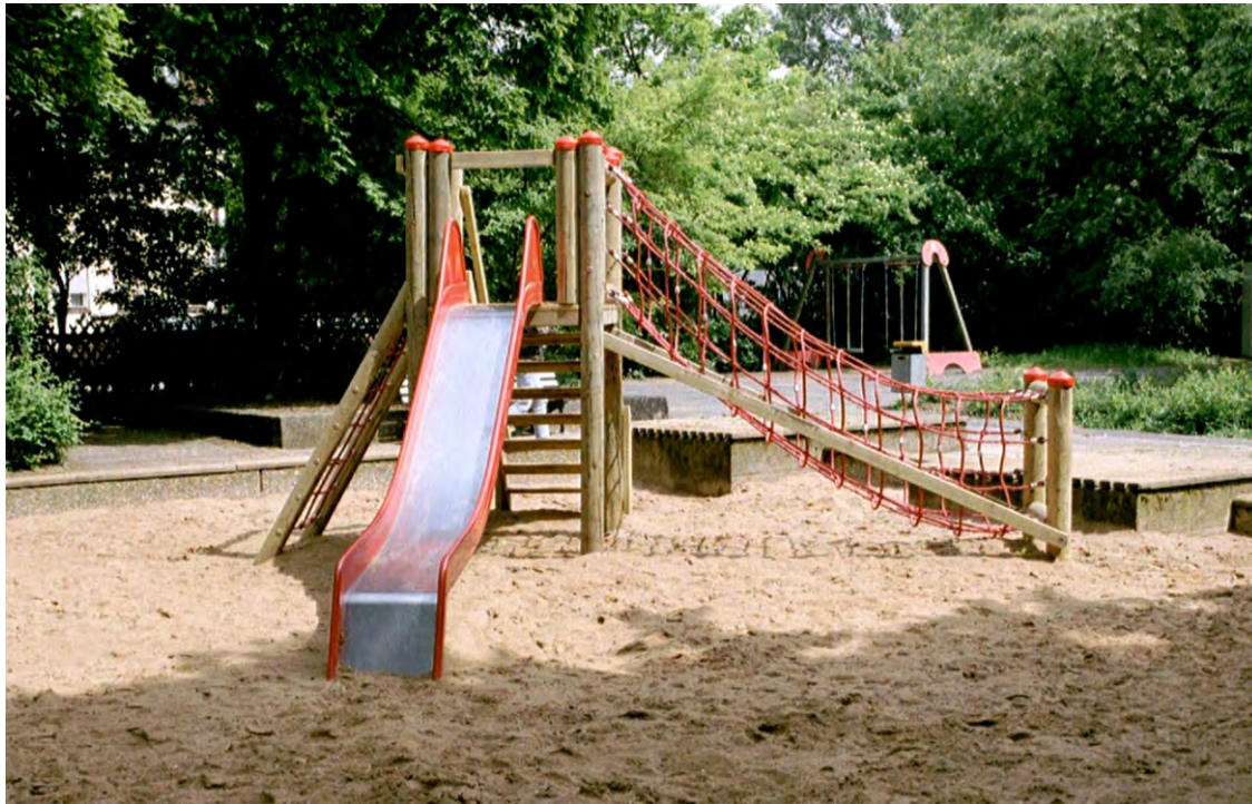
Abbildung: mit lackierter Rutsche, gegen Aufpreis