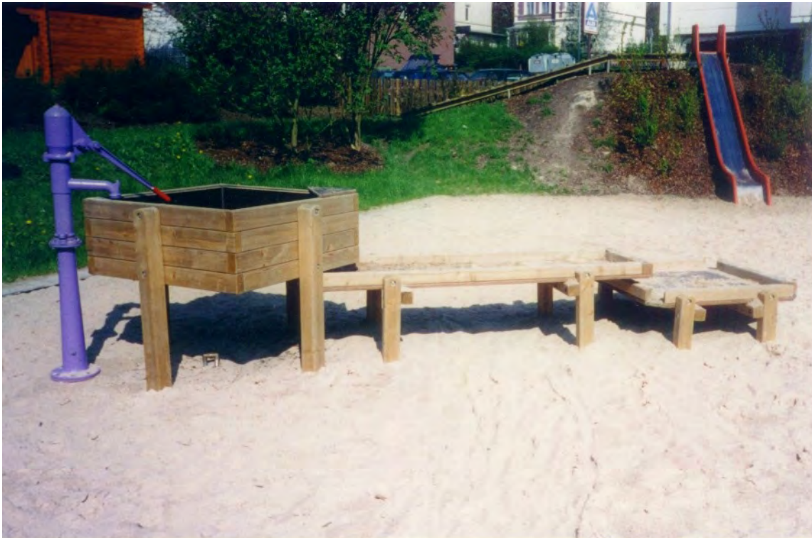
Abbildung: mit Spielplatzpumpe, im Lieferumfang nicht enthalten