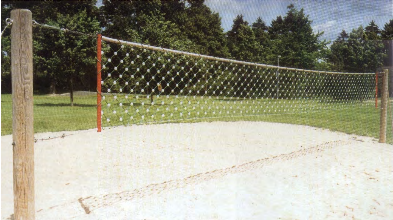
Abbildung: Volleyballanlage mit Holzstandpfosten