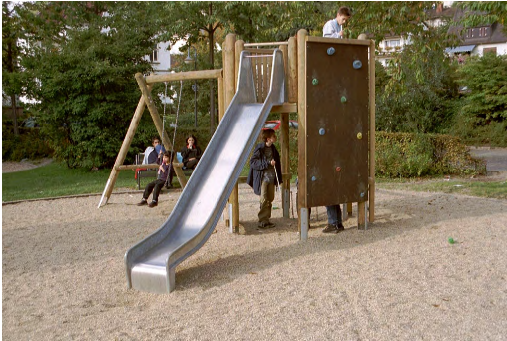
Abbildung: Anlage aufgeständert auf feuerverzinkte Pfostenschuhe, gegen Aufpreis