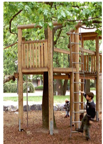
Kettenleiter mit Holzausleger