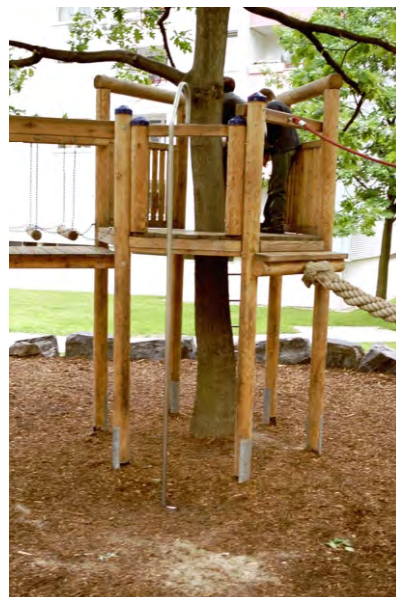
6-eck Podest mit integriertem Baum