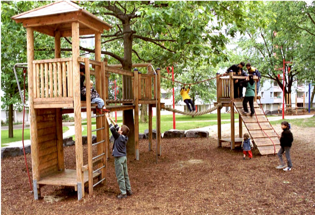
Abbildung: Spielanlage in Lärche roh, aufgeständert auf feuerverzinkte Pfostenschuhe, gegen Aufpreis

Spielen im Einklang mit der Natur ! Eine Spielanlage, die sich der natürlichen Umgebung anpasst. Der Drang zum Klettern, hervorgerufen durch den Baumbestand, kann hier durch viele unterschiedliche Elemente ausgelebt werden.