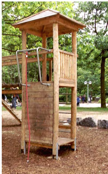
Kletterturm mit Metallausleger

Spielen im Einklang mit der Natur ! Eine Spielanlage, die sich der natürlichen Umgebung anpasst. Der Drang zum Klettern, hervorgerufen durch den Baumbestand, kann hier durch viele unterschiedliche Elemente ausgelebt werden.