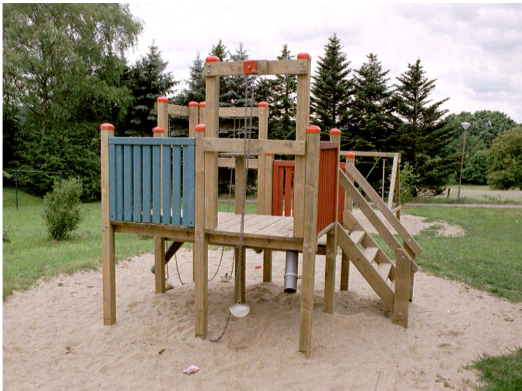
Abbildung: Sandspielanlage mit farbigen Seitenteilen, gegen Aufpreis