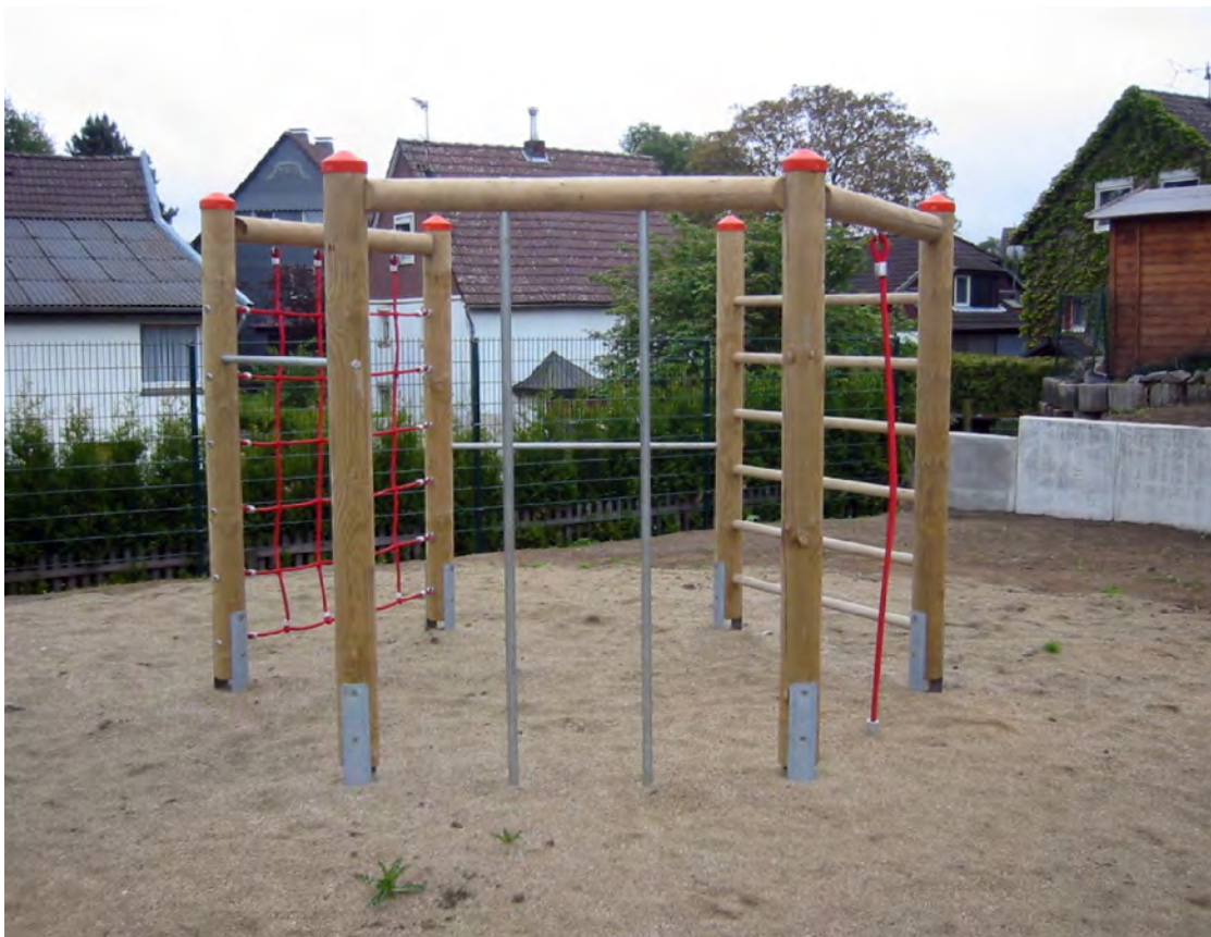
Abbildung: Anlage aufgeständert auf feuerverzinkte Pfostenschuhe, gegen Aufpreis