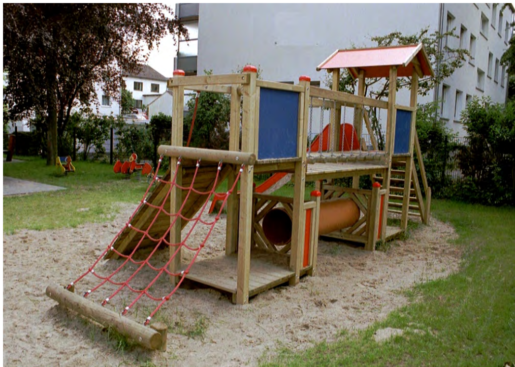
Abbildung: Anlage mit farbigem Dach und Seitenteilen aus HPL und lackierter Rutsche, gegen Aufpreis