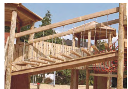
Kettenwackelsteg mit Durchtrittschutz

So sehen die Freiräume aus, die Kinder heute brauchen. Eine Spielanlage, die dem Spieltrieb und der Phantasie keine Grenzen setzt ! Ob klettern, hangeln, balancieren oder einfach nur das Tunnelgefühl in der Rutsche genießen. Die unteren Bereiche laden ein zu Rollenspielen oder einfach zum Relaxen.