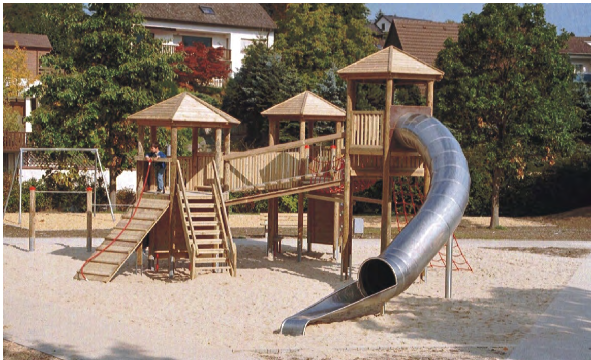
Abbildung: Spielanlage aufgeständert auf feuerverzinkte Pfostenschuhe, gegen Aufpreis