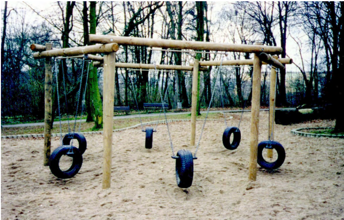
Abbildung: mit Systemaufhängung

Rundholz Ø 14 cm, kesseldruckimpräniert, Sicherheitsgummisitz mit senkrecht montierten Reifen, Schaukelketten verzinkt, V2A Einzelaufhängung mit Kardangeln oder V2A Systemaufhängung mit Welle Ø 25 mm und Drehwirbel.